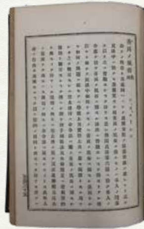
「善良ノ風俗」に関する語義 (部分抜粋)